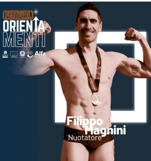
Filippo Magnini Nuotatore