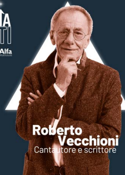
Roberto Vecchioni Cantautore e scrittore