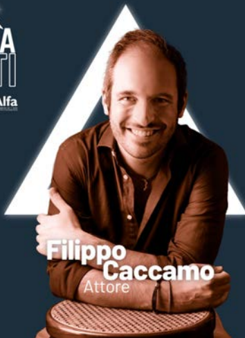
Filippo Caccamo Attore